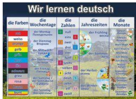
Артикул ШК-1504 Изучаем немецкий Размер 1,1x0,8 2660 РУБ