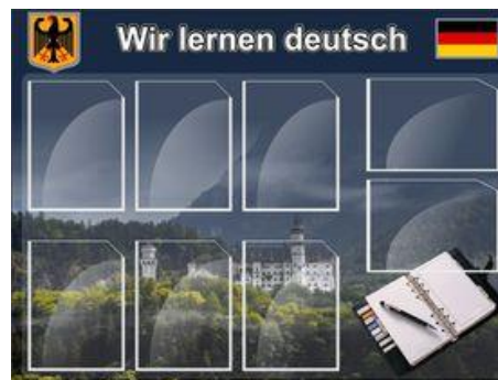
Артикул ШК-1505 Мы изучаем немецкий Размер 1,2x0,9