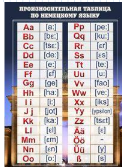
Артикул ШК-1507 Произносительная таблица Размер 0,8x1,1