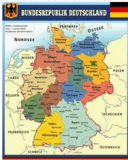
Артикул ШК-1508 Республики Германии Размер 0,8x1