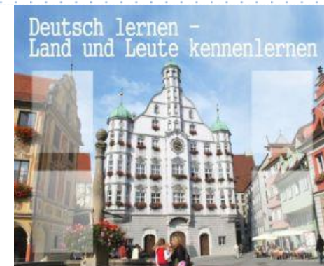
Артикул ШК-1501 Изучение языка и культуры Размер 1,2*1