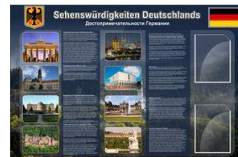
Артикул ШК-1503 Достопримечательности Германии Размер 1,5x1